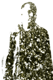
"Για το όνομα του σπουργιτιού"