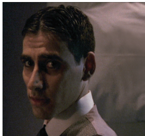
"Στο Δοκιμαστήριο του Κάφκα"